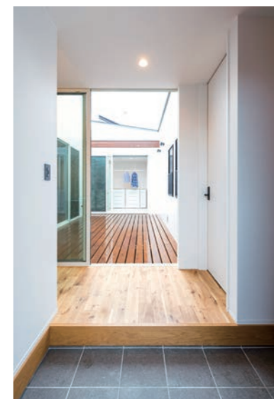
単なる「採光目的」ではなく「使いやすいこと」を重視した中庭は、まるで部屋のような。バーベキューに夏のプール、入浴後の夕涼みや夜の星空鑑賞など、暮らしの幅が大きく広がったそう。