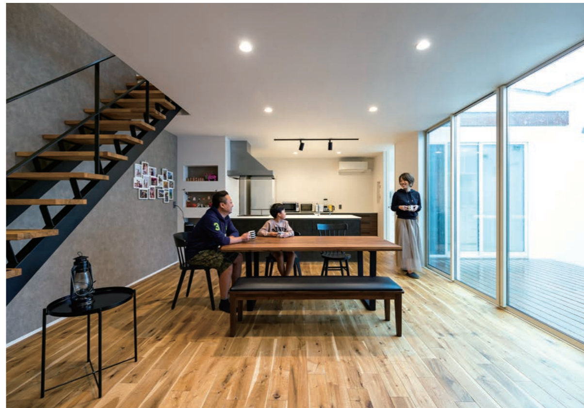
特筆すべきはLDKと中庭の一体感。人目が届かないため窓はカーテン不要、埃の心配もない。さらに奥様が憧れたアイアンのスクルトン階段に、その存在を引き立てるグレーの壁紙。オークの無垢床も含めて落ち着いたカラーでまとめており、幾つ歳を重ねても「飽き」を感じさせない。(この見開き頁の写真は一部を除きM氏邸)