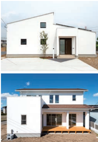
延床27坪とは思えないほど空間を広く、ムダなく使える中庭のある家。そして無垢材の優しさを活かした上品で可愛いデザイン。同じ素材でも、表現力次第でこうも変わる。(施工例)