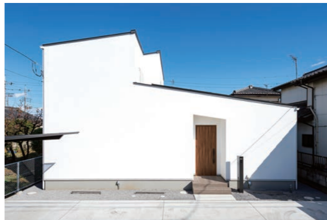
道路側に窓のない、外から室内の様子が絶対に分からない家。「遊びに来た友人も『この家、どうなの?』って驚きますね」と奥様。漆喰壁をライトアップした夜の景観も美しい。