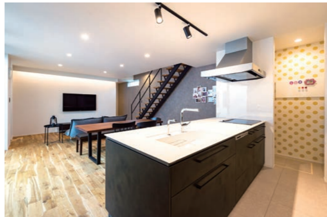
必要以上にモノを置かない、シンプルさが際立つ邸内。実はキッチン隣やTV後方といった「デザイン性を損ねずに済む、目立たない場所」にパントリーやWICなどの収納が豊富に設けられている。