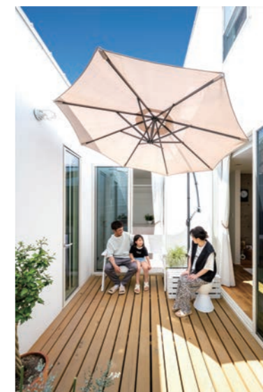
中庭があるからこそ、リビングやダイニングがより広く感じられる。晴れた日には部屋が一つ増えたかのよう。

企業DATA ㈱ウッドプラン 〒370-0857 群馬県高崎市上佐野町824-1 TEL.027-326-2348 U R L https://www.woodplan.jp/ E-mail contact@woodplan.jp