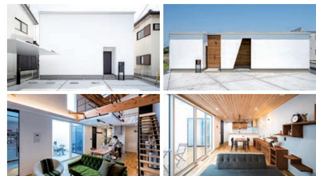
延床面積30坪前後とは思えないほど限られた空間を広く、ムダなく使うことを可能とした「中庭のある家」シリーズ。個性あふれる斬新な外観と自然素材、そしてプライバシー性の高さが特長。